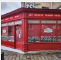
Lot n° 0