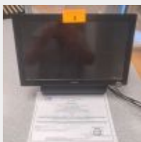
Lot n° 1

Caisse CASIO VR7000 écran tactile commerçant et écran client avec onduleur NITRAM, Imprimante ticket CASO Fournisseur BURELEC, 2017 3388€ TTC Mise à prix : 250€