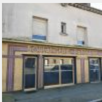
Lot n° 0