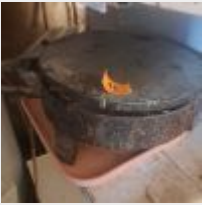
Lot n° 41 Galetière 3 Bouteilles de gaz Mise à prix : 40€