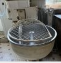
Lot n° 33 Pétrin cuve alu, 60 Litres Mise à prix : 100€