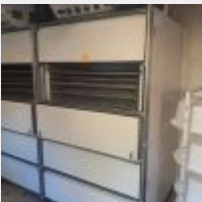
Lot n° 37 2 Chambres de pousse PANIMATIC, 32 étagères (fonctionnent), groupe intégré Mise à prix : 100€