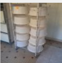
Lot n° 38 10 Bassines à pâtons sur échelle, poubelle PVC Mise à prix : 40€