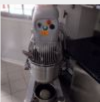
Lot n° 44 Batteur TEKNO STAMAP TIM V400/5/3 avec 2 bols inox 50 et 25L, 2 fouets, 2 crochets, 2 feuilles Année 2005 Se trouvant à RENNES Mise à prix : 900€ Vendu sur désignation Exposition le 14 avril de 9h30 à 10h, 42 rue Saint Georges à RENNES Enlèvement le 22 avril à 15h Suite LJS SARL CG, à la requête du TC de RENNES, Me BRILLAUD MJ