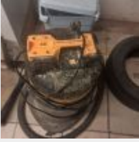
Lot n° 40 Aspirateur eau poussière (fonctionne) Mise à prix : 20€