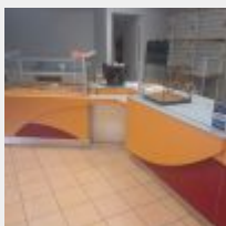
Lot n° 2

Caisse CASIO VR7000 écran tactile commerçant et écran client avec onduleur NITRAM, Imprimante ticket CASO Fournisseur BURELEC, 2017 3388€ TTC Mise à prix : 250€