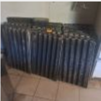
Lot n° 36 Lot de plaques à baguettes (usagées) Porte plaque inox Portant sèche couche Mise à prix : 80€