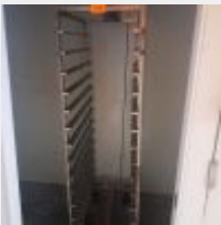
Lot n° 43 Echelle inox Mise à prix : 60€