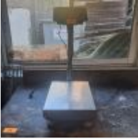
Lot n° 34 Balance TSX MF Mise à prix : 50€