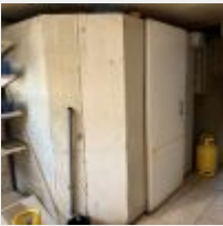
Lot n° 42 Chambre froide positive (fonctionne), environ 2 x 1 m avec angle (A démonter sans endommager le local) Mise à prix : 200€