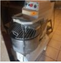
Lot n° 39 Spirale SPI PHEBUS (corrosion) Mise à prix : 20€