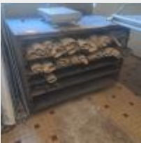
Lot n° 35 Machine repose pâton cassé, démontée Parisien en bois et couches Mise à prix : 50€