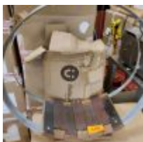
Table basse circulaire plateau verre 90 x 45cm dans 3 cartons Mise à prix : 10€ Vendue par la SVV ADJUGE, Frais de vente : 24% TTC