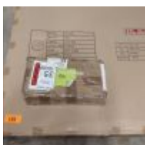
Table basse ANTOINE MOTARD modèle BOSTON piètement blanc, plateau ovale en verre, en carton Mise à prix : 10€ Vendue par la SVV ADJUGE, Frais de vente : 24% TTC