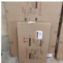
Table plateau verre ANTOINE MOTARD modèle Léa en carton 180 x 90 x 76cm environ Mise à prix : 10€ Vendue par la SVV ADJUGE, Frais de vente : 24% TTC