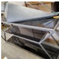
Table basse en placage de chêne 100 x 100 x 30cm environ Mise à prix : 10€ Vendue par la SVV ADJUGE, Frais de vente : 24% TTC