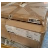
Table basse circulaire piètement en chêne blanchi plateau verre diamètre 100cm dans son emballage d'origine Mise à prix : 10€ Vendue par la SVV ADJUGE, Frais de vente : 24% TTC