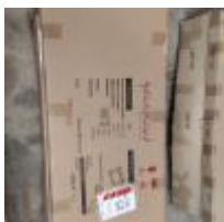
Table basse circulaire plateau verre 90 x 45cm dans 3 cartons Mise à prix : 10€ Vendue par la SVV ADJUGE, Frais de vente : 24% TTC