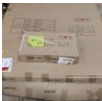
Table plateau verre ANTOINE MOTARD modèle Léa en carton 180 x 90 x 76cm environ Mise à prix : 10€ Vendue par la SVV ADJUGE, Frais de vente : 24% TTC